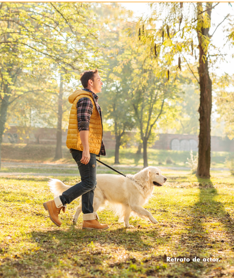
Retrato de actor.

Es posible que esté pensando en someterse a una cirugía bariátrica (pérdida de peso) o que posiblemente ya haya decidido someterse a ella. Puede que se sienta un poco nervioso, incluso un poco asustado. Pero, sobre todo, probablemente se sienta esperanzado.